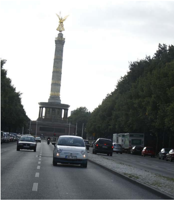
Auf dem Weg durch Berlins Mitte